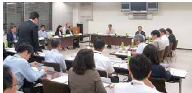
▲震災復興検討委員会

詳しくは、 熊本市震災復興計画 または復興総務課(☎096-328-2971)へ