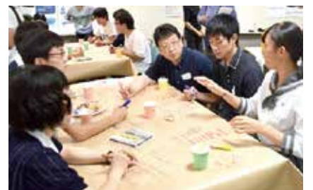
▲くまもと復興カフェ