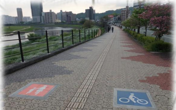
歩行者優先で通行しましょう