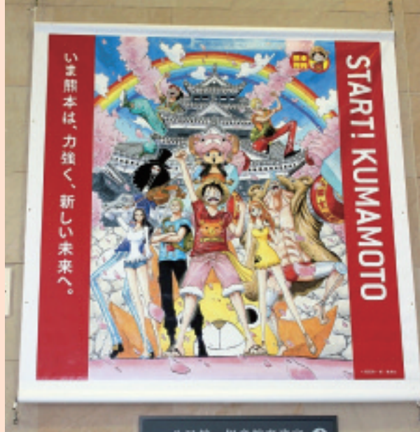
(画像: ©尾田栄一郎/集英社)