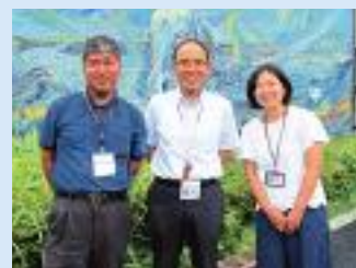
(秋津まちづくりセンター)

私たち地域担当職員は、各校区で行われている地域活動やイベントに参加し、広報誌やSNSで活動の様子を紹介しています。市民の皆さんに、地域で行われていることを知っていただく手段にもなりますし、ほかの校区の活動を知ることでお住まいの地域のまちづくりのヒントとなれば良いと思っています。今後も地域の活動に積極的に参加し、地域情報の収集・発信を行っていきます！