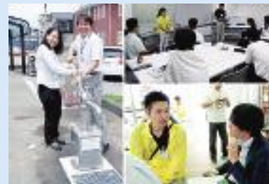
(東部まちづくりセンター)