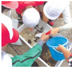
「海辺の生物調べ」には河内小・芳野小の5年生が参加。子どもたちにも環境保護の意識が芽生えます

住民一人一人の「地域の環境を守る」という思いが一つになったことで取り戻された河内町の自然。町では、今年も川でホタルが乱舞する時期に合わせて「ホタルまつり」が開催される予定です。