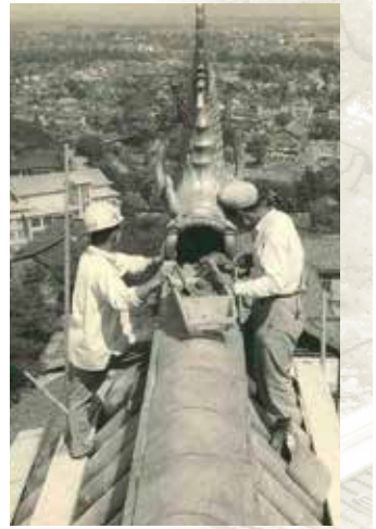
▲大天守鯰瓦の据付 (個人蔵)