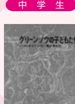
グリーン・ノウの子どもたち L.M.ボストン 作 評論社