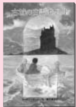
古城の幽霊ゴースト スーザン・クーパー 作 岩波書店