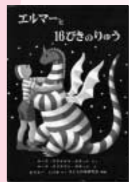
～エルマーのぼうけんシリーズ～ エルマーのぼうけん エルマーとりゅう エルマーの16びきのりゅう ルース・スタイルス・ガネット 作 福音館書店