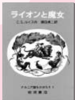
ライオンと魔女 ナルニア国ものがた(1) C.S.ルイス 作 岩波書店