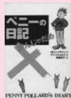
ペニーの日記 読んじゃだめ ロビン・クライン 作 偕成社