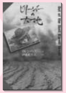
ブリー・ジョーの大地 カレン・ヘス 作 理論社

*教育委員会の広報誌は熊本市のホームページでも見ることができます アドレス http://www.city.kumamoto.kumamoto.jp/kyouikuiinnkai/kouhou/kouhou.htm