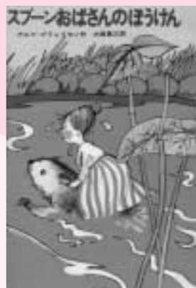
スプーンおばさんのぼうけん アルフ=ブライオン 作 学研