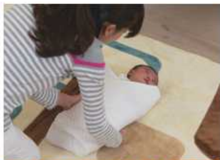
おくるみで包んであげる

次に、たとえば赤ちゃんがお母さんのお腹 なか の中にいたときの 状態 じょうたい を思い出させてあげましょう。