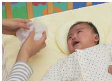
ビニールをクシャクシャさせる

その他に、ドライブに行くなど、心地 こころ よい振動 しんどう で泣きやむこともあります。いろいろ試 ため してみましよう。 また、高熱 こうねつ が出ていたり、心配 いりょうき であれば、医療機関 いりょうきかん を受診 じゅしん しましょう。