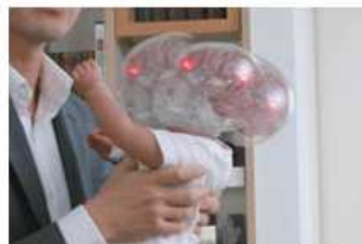
※揺さぶりの危険性を伝える人形

赤ちゃんの泣き声に、ついイライラし、激しく揺さぶってしまう。実際に激しい揺さぶりを目の当たりにした保健師の方に伺いました。