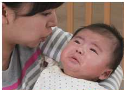
「シー」という音を聞かせる