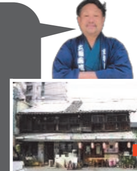
上村元三商店 魚屋町3-13

この助成制度を長く続けて頂き、城下町の風情を感じられる町並みが広がるとよいと思います。 懐かしさと新しさの融合する店づくりを行い、人々のコミュニケーションの場となる運営をしています。