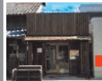
かわばた 中唐人町12