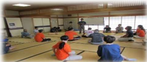
昨年の受講のようす