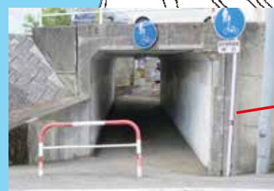
大雨時道路冠水(トンネル)