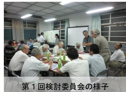
第1回検討委員会の様子