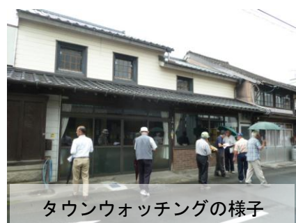
タウンウォッチングの様子