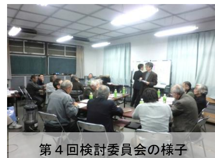
第4回検討委員会の様子