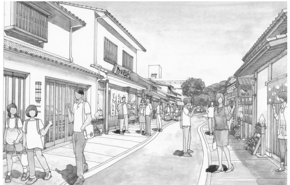
(小路町改修後のイメージ)

この事業は、川尻地区にある建物などの所有者や居住者の方が、町並み協定の基準に沿った町屋などの「伝統的な建造物の保存・修景のために行う工事」や、一般建造物の「川尻地区の歴史が醸し出す伝統的な雰囲気を感じられる町並みとの調和を図るための工事」に対して、予算の範囲内において、 外観工事費の一部を助成する ものです。