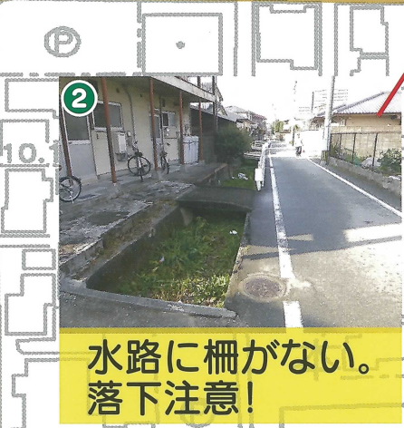
水路に柵がない。 落下注意!