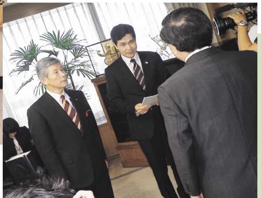
蒲島県知事へ「熊本市・城南町合併協議会」設置の届出を行う幸山会長（熊本市長）と八幡副会長（城南町長）

合併協議会は、両市町の行政および議会の代表者並びに学識経験者として各種団体の代表者、県職員などを委員として構成され、今後、月1回程度開催していきます。