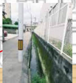
浸水しやすい箇所