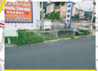
ガードレールがない水路