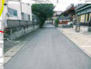
浸水しやすい箇所