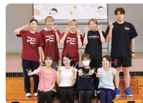
大学生が企画から当日の運営ボランティアまでサポートしてくれました!

学生が地域に対して前向きなマインドをもってボランティアに取り組んでいる姿が見られて安心しました。今後も地域のイベント等に自信をもって送り出せると思っています。(九州ルーテル学院大学 アウトリーチセンター)