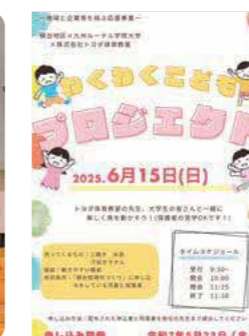
ネーミングやチラシ作りも