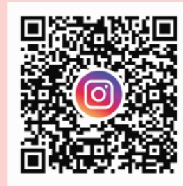
熊本市中央区 公式Instagram