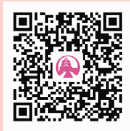
熊本市中央区地域と 企業等を結ぶ応援事業