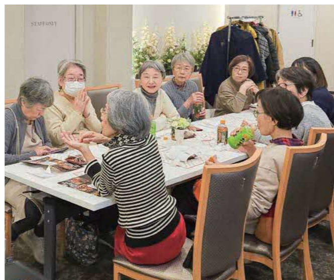
おせちの試食会で歓談♪(茶話会の様子)