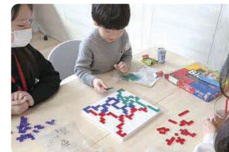
こどもの居場所作りプラン談話室