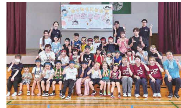
小学生、保護者、大学生、地域関係者など80名超が参加して大盛り上がり!

普段の放課後の居場所づくりに加えて「碩台校区の小中学生が楽しめることがしたい!」という地域の想いから、トヨタ体育教室の人気競技 × 九州ルーテル学院大学の学生のアイデアで全5種目のゲームを企画しました。