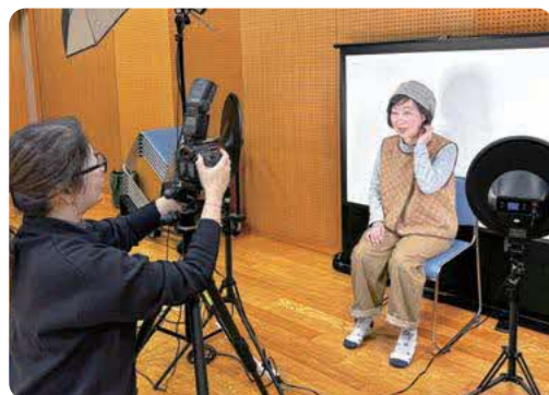
ファミリーユの撮影会ではプロの仕上がりに大満足♪