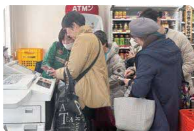
セブン-イレブンのマルチコピー機を体験!

地域の方と直接ふれあい、想いやニーズを深く知る貴重な機会となりました。今後も連携を大切に、地域の皆さまに信頼され、お役に立てる存在であり続けたいと考えております。(家族葬のファミリーユ)