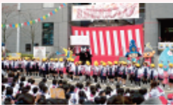
(写真: 昨年の様子です)

日時 11月8日(日) 午前9時20分～午後2時半 場所 五福まちづくり交流センター、細工町通り 内容 すり鉢舞、ステージ(舞踊団 花童、もっこすファイヤー、ハワイフラ、子ども神輿 ほか)、五福風流街商栄会による出店、活き人形師 松本喜三郎に関する展示 ほか