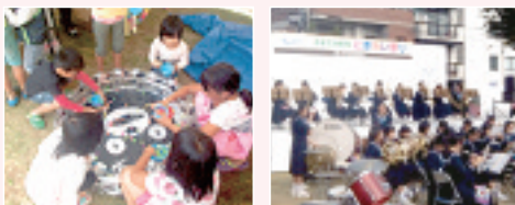
(写真: 昨年の様子です)

日時 前夜祭 11月7日(土) 午後5時～9時 本祭 11月8日(日) 午前10時～午後7時 ※小雨決行、荒天の場合は15日(日)に延期。 ※時間は会場によって異なります。