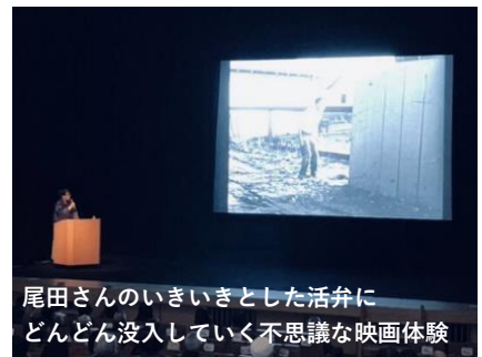
尾田さんのいきいきとした活弁に どんどん没入していく不思議な映画体験

2月10日(土)には、新市街 Deckinにて単独公演も。アスパルにチラシあります。