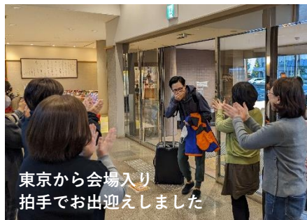
東京から会場入り 拍手でお出迎えしました