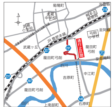
(北部土木センター工務課 ☎245-5064)