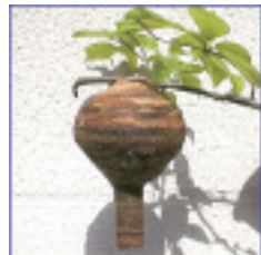
初期のスズメバチの巣(4月頃～6月頃)