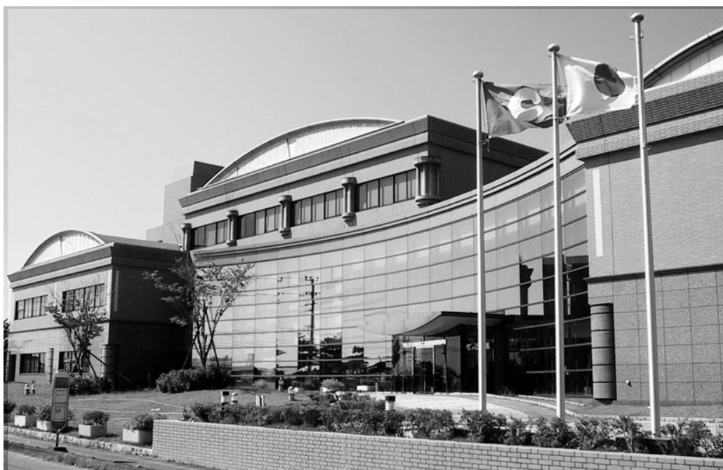
熊本市環境総合センターの全景