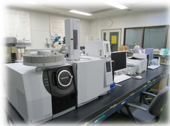
クアトロプル四重極型ガスクロマトグラフ質量分析装置 (平成 30 年度導入)

内分泌攪乱化学物質 (通称、環境ホルモン) については、平成 13 年度に 10 地点で 3 物質の調査を開始し、平成 19 年度には 18 物質に対象物質を拡大して調査を行いました。平成 20 年度からは、市内の検出状況を整理してこれまでの傾向が分かってきたことから、対象物質を魚類への影響があるもの 4 物質と熊本市の調査で検出された 3 物質の計 7 物質について調査を実施してきました。