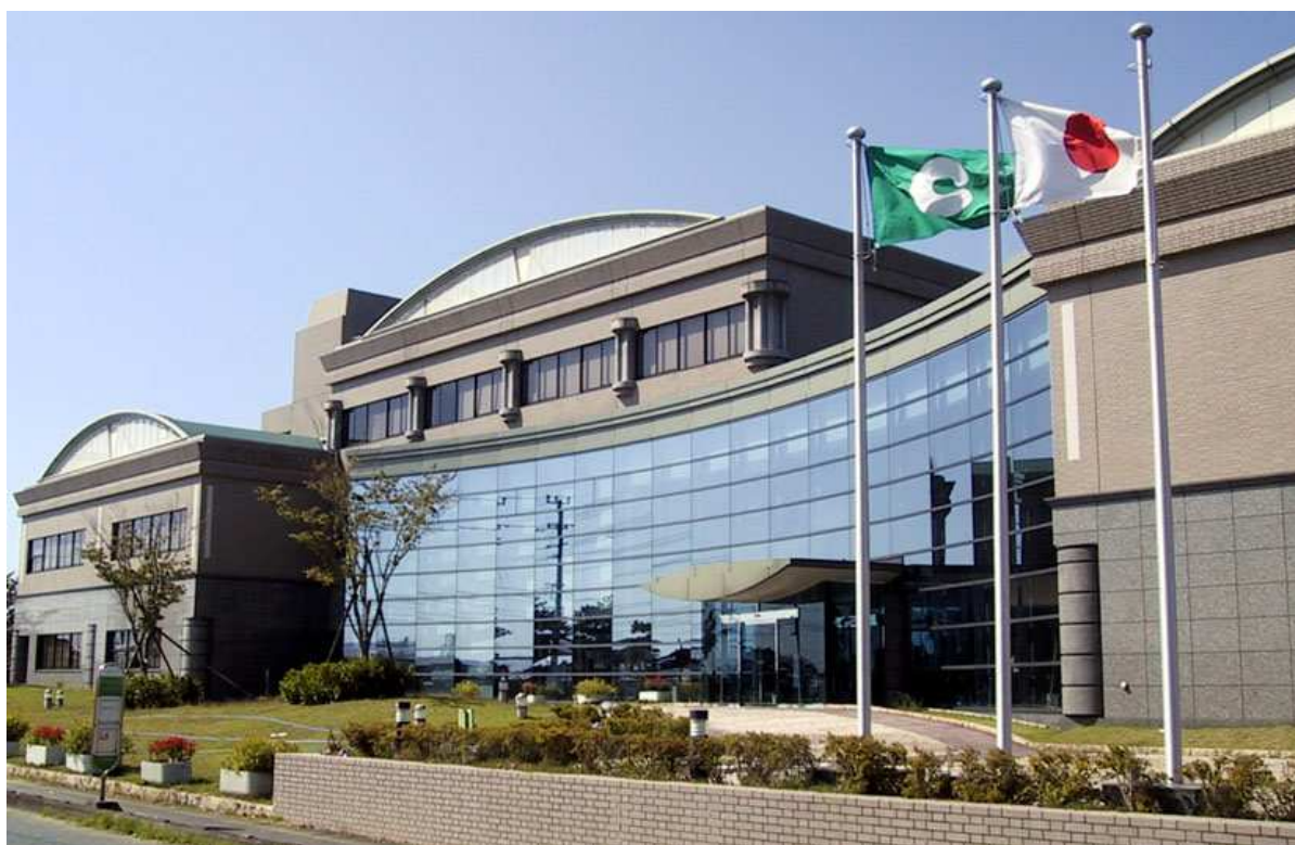
熊本市環境総合センターの全景