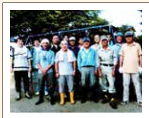
ボランティアとして多くの地域住民や地元企業の皆さんが清掃活動に参加しています。