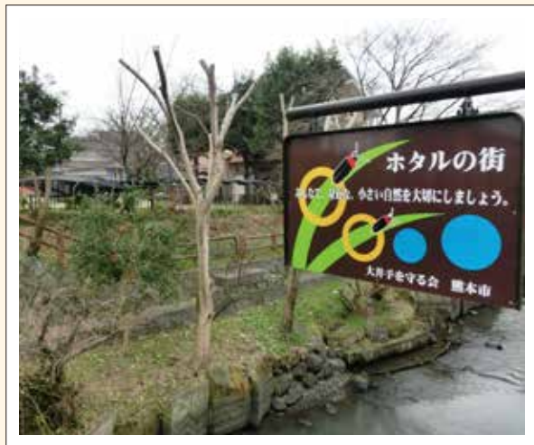
平成8年5月に設置されたホタル看板。「大井手を守る会」の皆さんを中心に大井手の環境保全活動が続けられています。活動は、毎月第1日曜の早朝からです。お気軽にご参加ください！