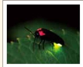
大井手隣接の北原公園(渡鹿5丁目公園)内にあるホタル飼育施設。ここで育ったホタルが、毎春井手へ飛来します。