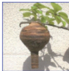
初期のコガタスズメバチの巣

冬を越した女王バチは、4月~6月頃までに1匹で巣を作り、卵を産み付けます。 卵から羽化した働きバチが活動を始める前に巣を発見できれば、比較的安全に駆除することができ、駆除の費用負担も少なくて済みます。