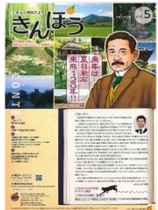
2 西区だより作成経費