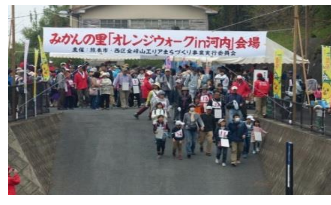
10 エリア別まちづくり事業