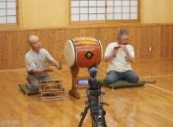
5 伝統文化保存継承事業