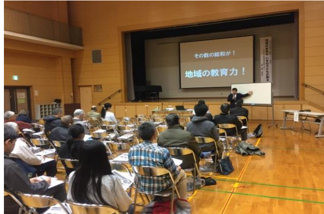
4 西区地域活性化支援事業 (地域活性化の講演会)