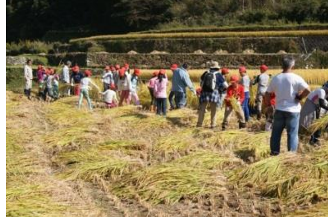
8 子ども農山漁村交流事業