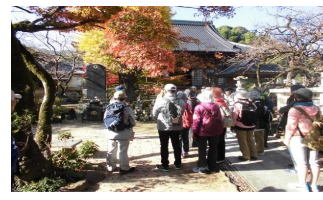
10 エリア別まちづくり事業