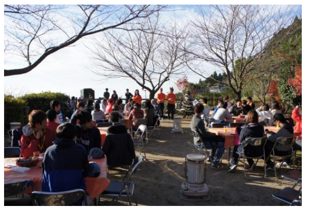
11 大学連携まちづくり推進事業