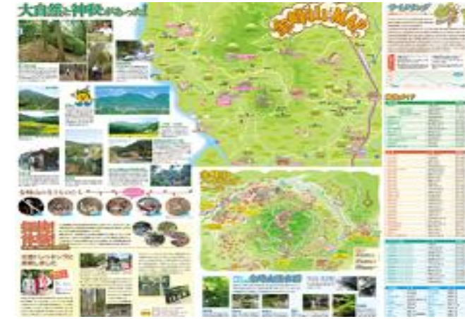
4 西区地域活性化支援事業 (お宝マップ作成)