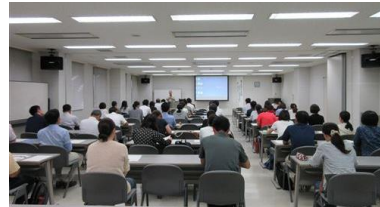
【人権文化セミナー】