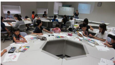
【家庭教育学級あぼろんの会】