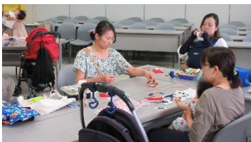
【ベビーソーイング】