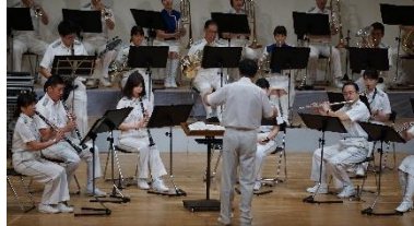
【トライアングルコンサート】