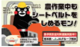
▲農作業安全啓発ステッカー

毎年、県内では10人前後の尊い命が農作業事故で失われています。特に、65歳以上の高齢者による事故