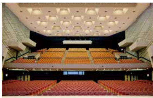
▲大ホール完成予想図

※ 事前予約は、受付期間後の翌月初めに開く調整会議で決定します。通常予約は、先着順で決定します。