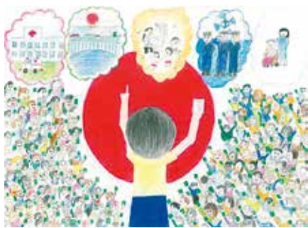
▲平成28年 公益財団法人明るい選挙推進協会会長 都道府県選挙管理委員会連合会会長賞

申込み 9月1日までにポスターは作品の裏面に、習字は作品の裏面左下に紙を貼り、住所、氏名、性別、学校名・学年を書いて、持参か郵送で〒860-8601選挙管理委員会事務局(住友生命ビル9階 ☎096-328-2771)へ