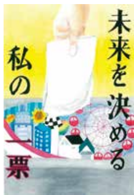
▲平成28年 熊本県選挙管理委員会 委員長賞