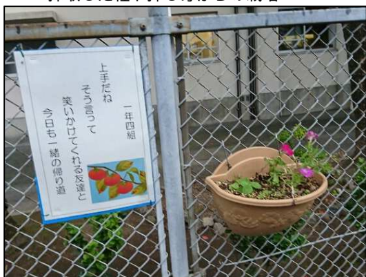
「心の花」の掲示 (人権標語)