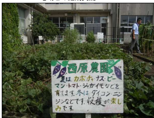
農園での農作物作り