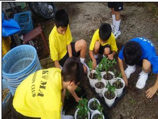
採取した種や挿し芽からの栽培