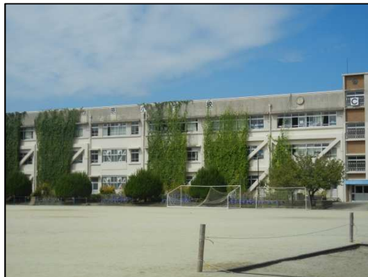
壮大な「緑のカーテン」