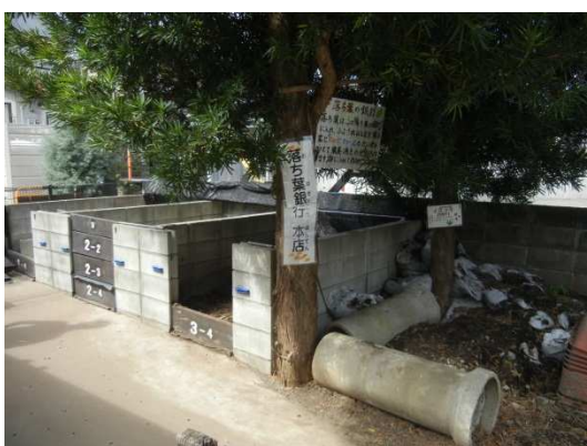
腐葉土作りのための「落ち葉の銀行」