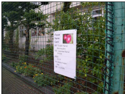
イングリッシュガーデン (草花の英名を札に表示)