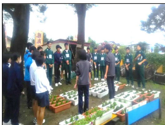
生徒会フラワーメール活動 (青少協との連携)