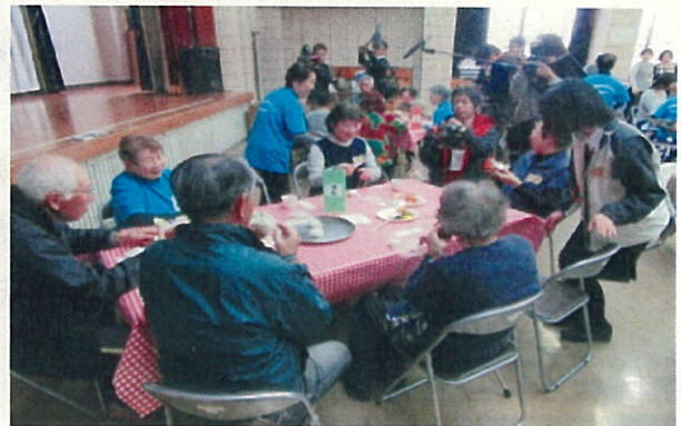
みなし仮設など入居者交流会