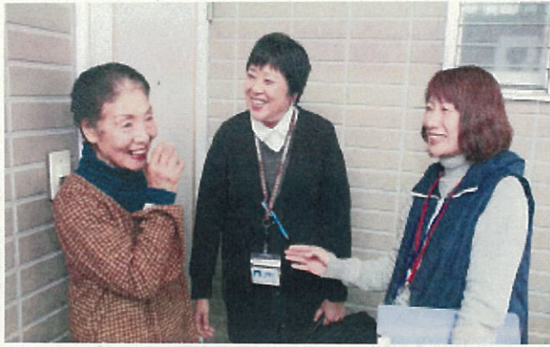
看護師による見守り訪問活動