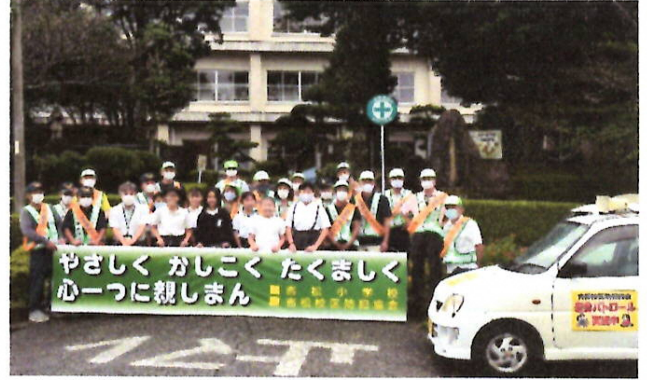
新調横断幕を前に児童代表と防犯協会員