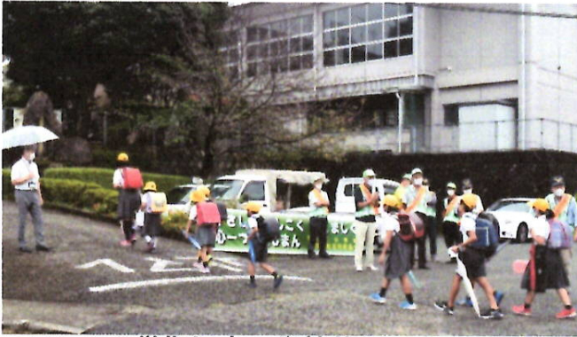
二学期児童の登校状況