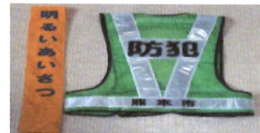
新調のベスト・たすき