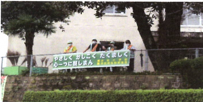
小学校正門北側フェンスに掲げた横断幕