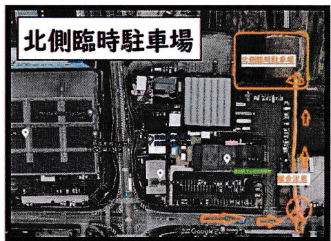
すいかの里植木、正面駐車場の 入口過ぎて、すぐ左折

駐車場には限りがございます。北側臨時駐車場ご利用のご協力 お願い申し上げます。※駐車場への道幅が狭い為、離合注意!