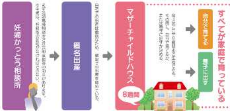
ドイツでの母子を守る取り組みの流れ

*文庫/高橋由紀子：ハンブルグの「捨て子の赤ちゃんプロジェクトの援助を利用した女性たち」 早稲大学26(1)：88-106,2009