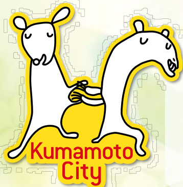
障がい者サポーター制度 シンボルマーク

市内には4万人以上の障がいのある方々が暮らしています。私たち自身も人生の途中で病気をしたり年をとったりして、心身の機能が低下する可能性があります。障がいのある人が暮らしやすいまちは「みんなが暮らしやすいまち」。誰もが自分らしく、わくわくして暮らせるまちづくりのために、あなたの力が必要です。