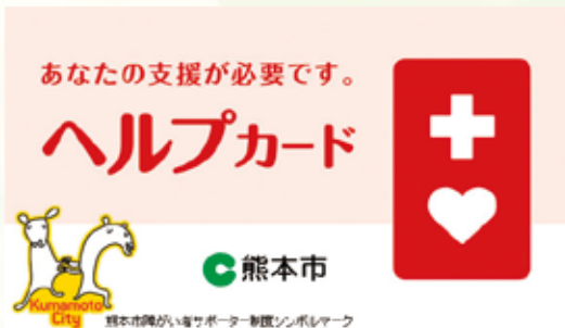
▲熊本市版ヘルプカード