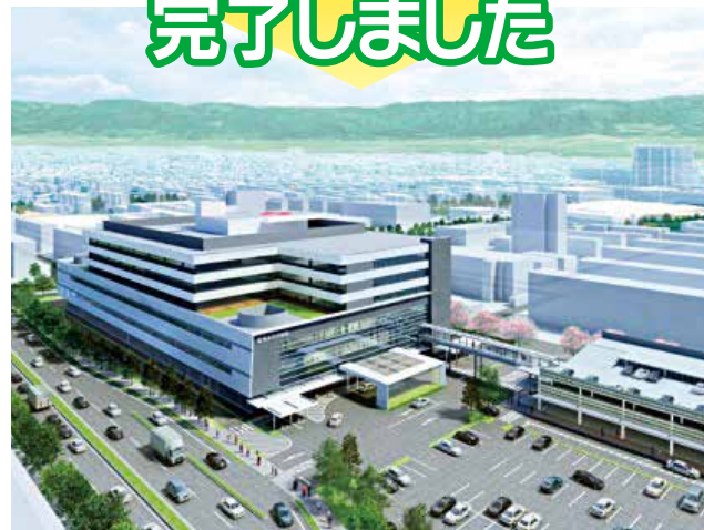
※イメージ(今後変更の可能性有)