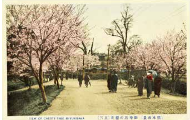
▲明治の終わりから大正中頃と推定される、行幸坂の写真(着色)の絵葉書※「御幸坂の桜花(其三)」

行幸橋・行幸坂はこの行幸のために整備されたものです。もとは、行幸橋は下馬橋、行幸坂は南坂と呼ばれていました。南坂は傾斜が急な坂だったので、傾斜をゆるやかにして馬車が通りやすくするための造成工事が行われました。この工事は高いところで26尺(約8m)の盛土が必要となる大掛かりなもので、大量の土や石が必要でした。そのため熊本県知事は、「熊本城内で支障のない場所の石垣とその内部の土石を盛土用に使わせてほしい」と陸軍へ願い出ています。これに対し、陸軍は行幸坂・行幸橋の改修予定を示した図の「甲」部分の石垣(馬具櫓の向かい側)とその内部の土石の引渡しを認めています。そして、工事が行われた行幸坂から、直線的に市街地へ向かうことができるように坪井川を渡る橋の架け替えも行いました。当時、下馬橋から坂へ向かうには屈曲した