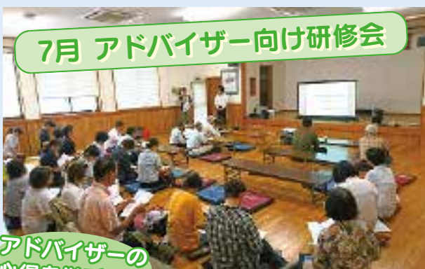
7月 アドバイザー向け研修会 アドバイザーの心得を学びます

認知症は誰にとっても身近なことからです。東区では、認知症になってもできる限り住み慣れた地域で暮らし続けるために、子どもから高齢者まで地域全体で見守り支えあう地域活動を推進しています。自分や家族が認知症になったら…我が事として考え、仲間を誘い、自分にできることから始める取り組みが広がっています。その中から今回は、長嶺校区で行われた徘徊模擬訓練の様子を紹介します。