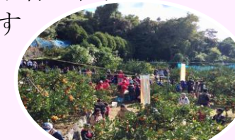
↑好評の河内オレンジウォーク