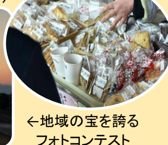
←地域の宝を誇るフォトコンテスト