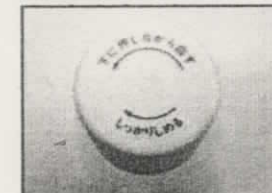
CR容器(押しまわし式)のキャップ