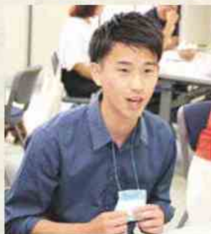
▲参加した大学生たちのフレッシュな意見は、どのテーブルでも注目的!

また、自分と子どもの“1日の予定”を書き出して、親だけでは見守れない時間帯を洗い出し、その時間にどうすれば見守りができるかについてもアイデアを出し合いました。