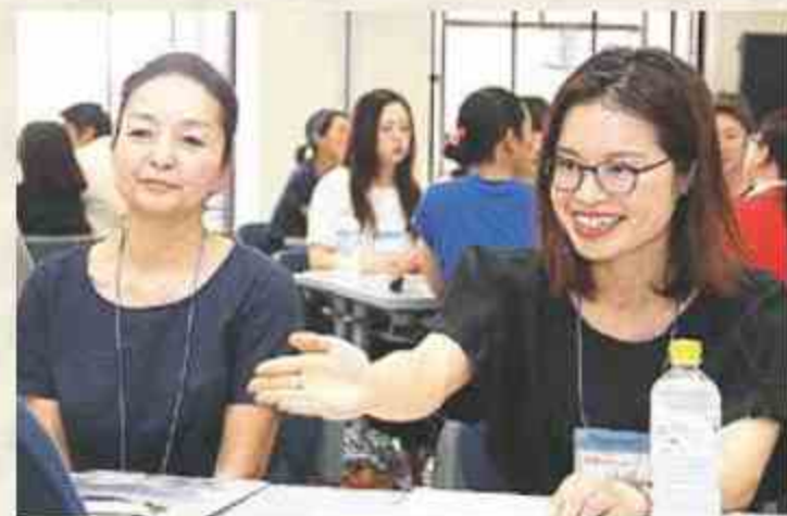
▲各テーブルでは自己紹介も兼ねて、それぞれに自分の意見を出し合っています