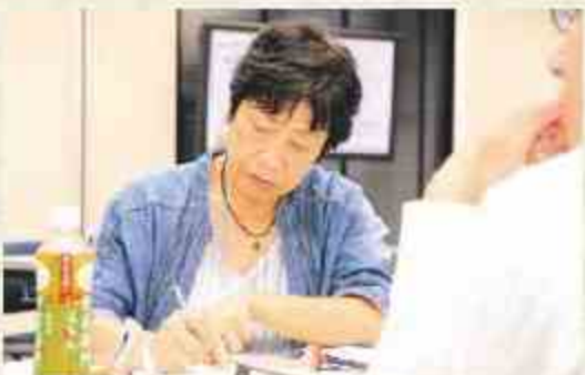
実際に基づく山内さんの発表やアドバイスを聞きながらメモを取る参加者