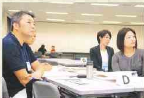
お祭り形式のPTA主催の防災キャンプの事例発表に秋田県七尾市長の