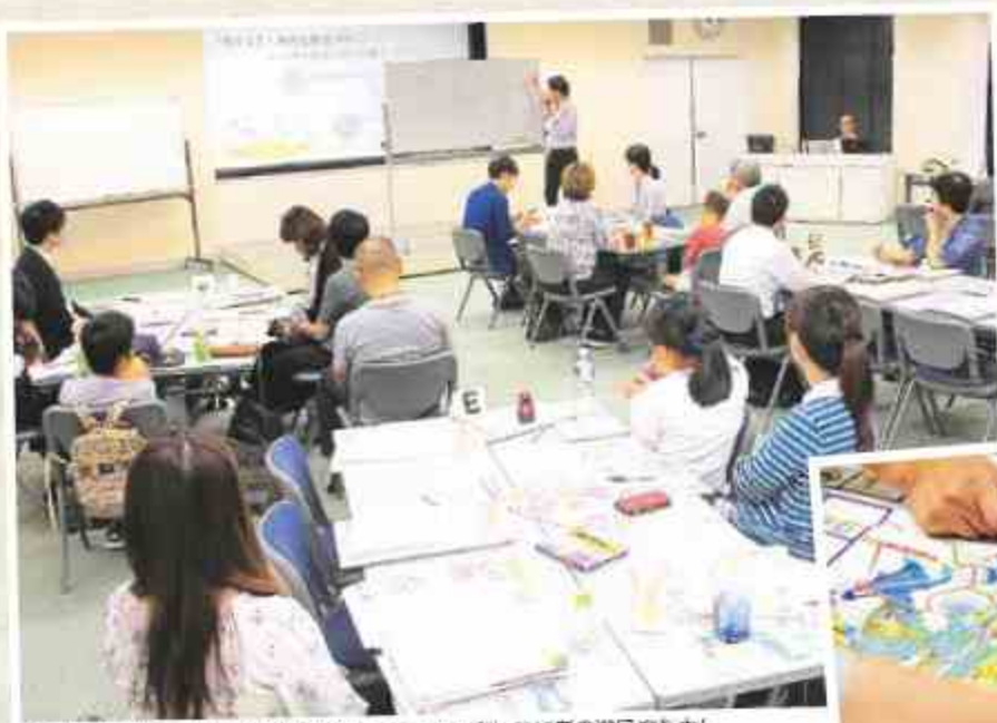
事例発表、ハザードマップ作りと盛りだくさんの内容に参加者の満足度も大!