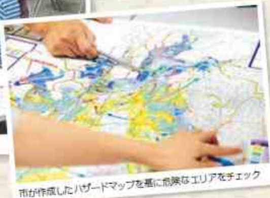
市が作成したハザードマップを基に危険なエリアをチェック