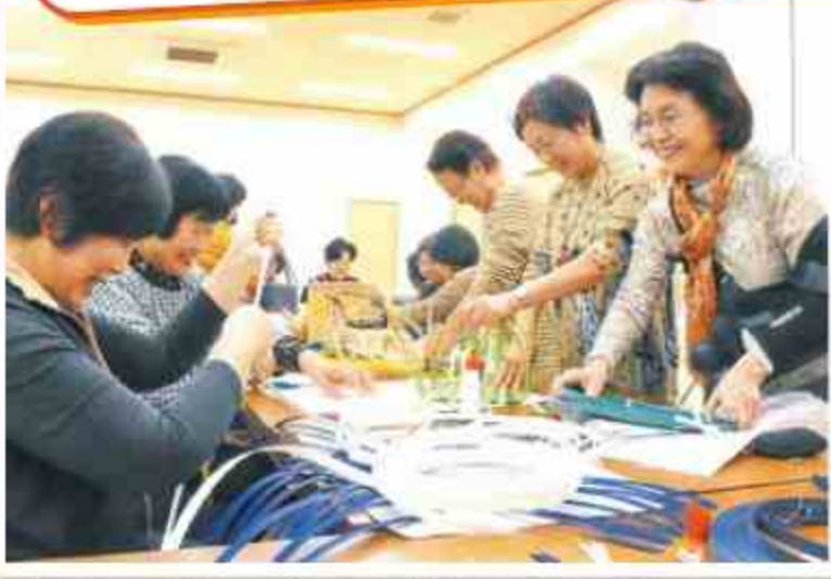
▲熊木コミセンで行われている「紙バンドカゴ教室」の様子。参加者からは「出来上がった達成感はもちろん、雑談の中で悩みを打ち明けたり、現実を忘れて作業に没頭したりすることで、ストレス発散になります」との声も

「熊本市地域コミュニティセンター」って どんなどころで、どんな役割を 果たしているの?