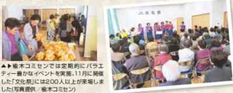
▲熊木コミセンでは定期的にバラエティー豊かなイベントを実施。11月に開催した「文化祭」には200人以上が来場しました