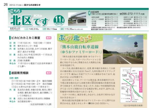
出典：市政だよりくまもと (H24. 11)