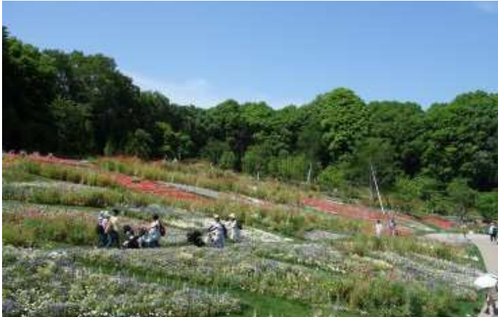
里山ガーデン（公園予定地）