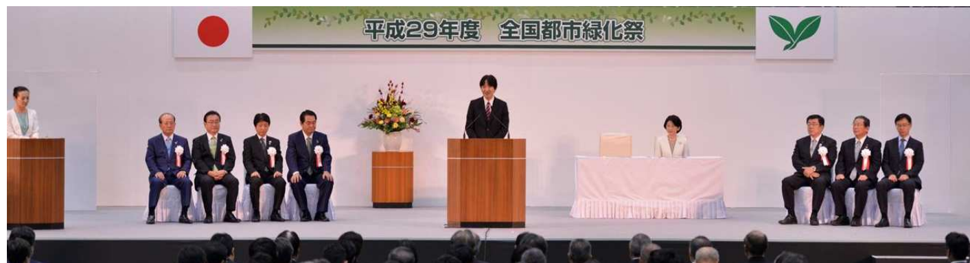
全国都市緑化祭記念式典

主 催：国土交通省、地方公共団体、(公財)都市緑化機構 行事内容：式典（おことば、国土交通大臣表彰等）、植樹 他