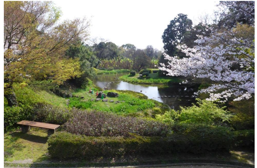
▲ 現状全景(北側から)