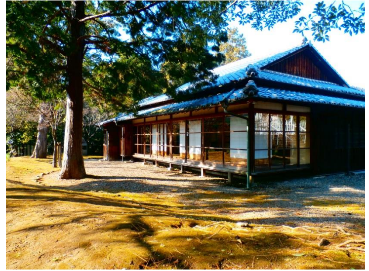
▲ 夏目漱石第三旧居(大江旧居)