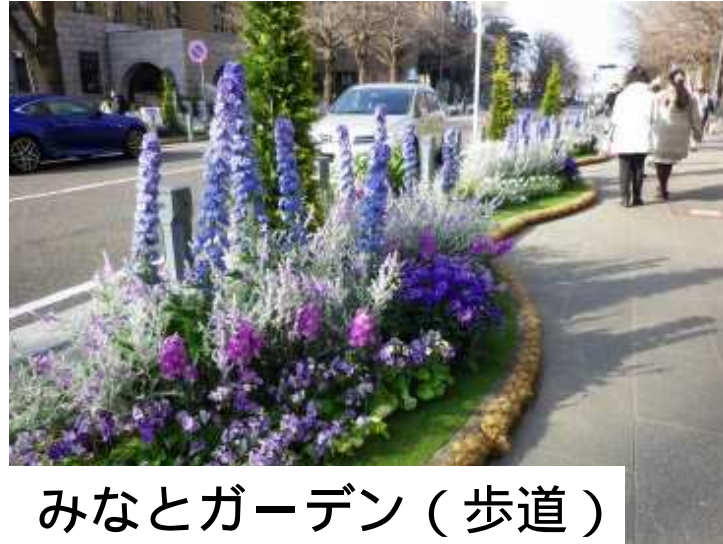
みなとガーデン（歩道）