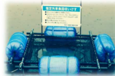
指定外来魚回収いけす