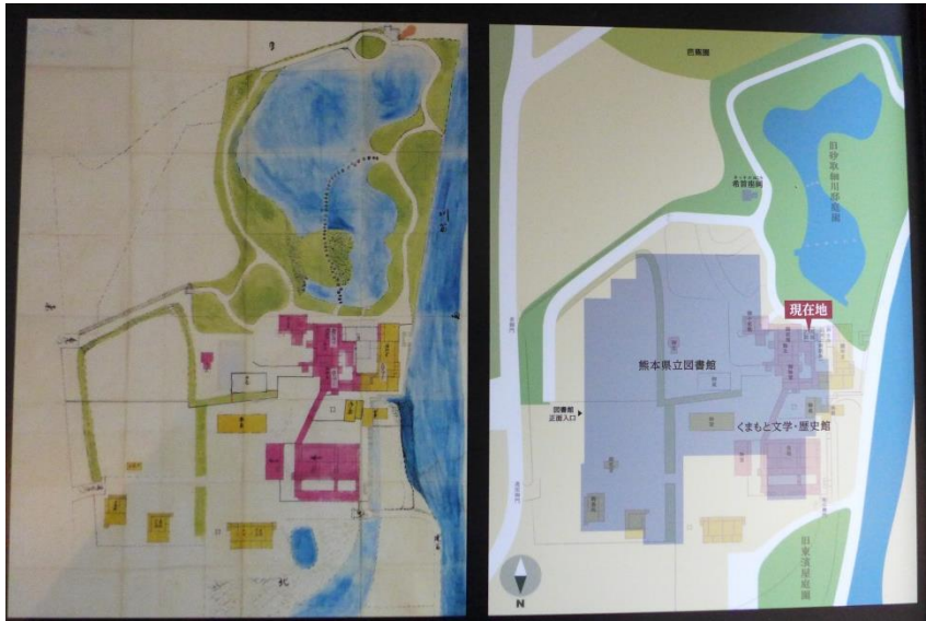
▲ 明治7年の絵図(左)と現状図(右) (くまもと文学・歴史館内案内板)