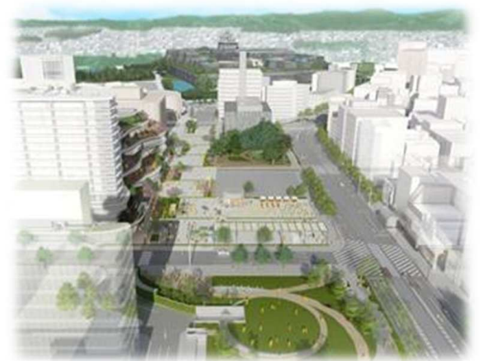
シンボルプロムナード周辺