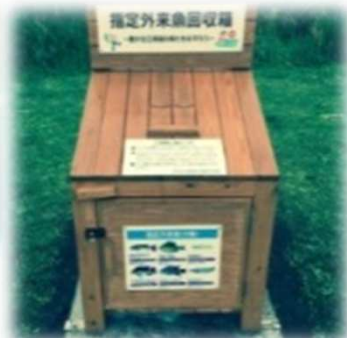
指定外来魚回収箱