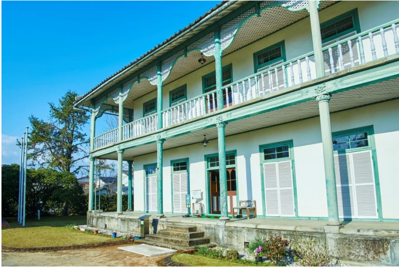
▲ 熊本洋学校教師ジェーンズ邸 (震災前)