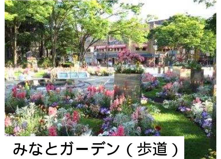
みなとガーデン（歩道）