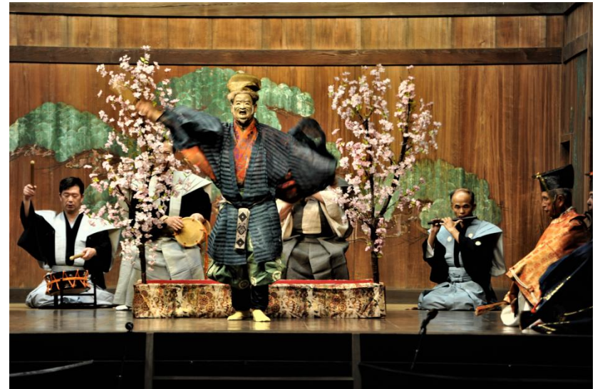
▲ 能楽殿(水前寺成趣園内)