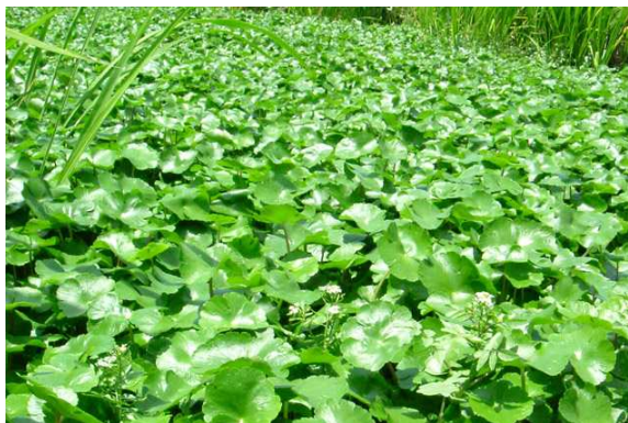
ブラジルチドメグサ