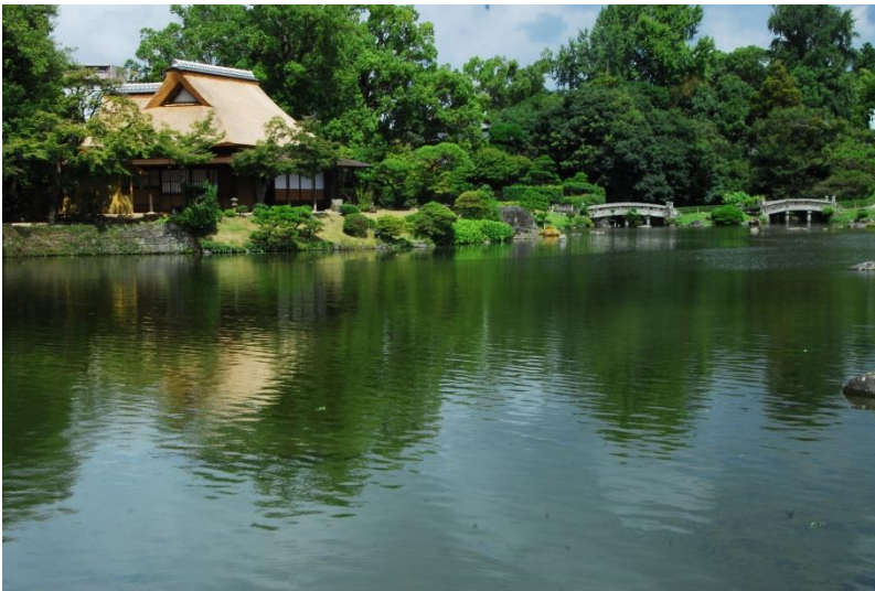
▲ 古今伝授の間(水前寺成趣園内)