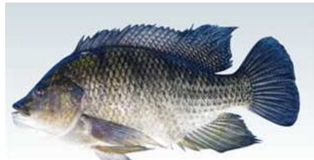
ナイルティラピア