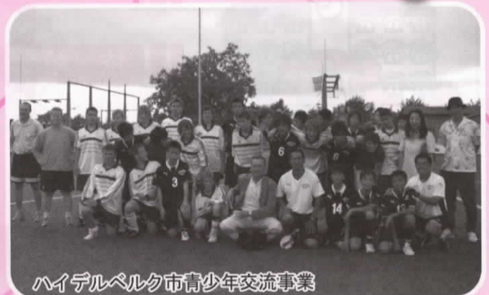
ハイデルベルク市青少年交流事業

(受入) 平成20年8月7日～8月10日 (派遣) 平成21年1月9日～1月12日