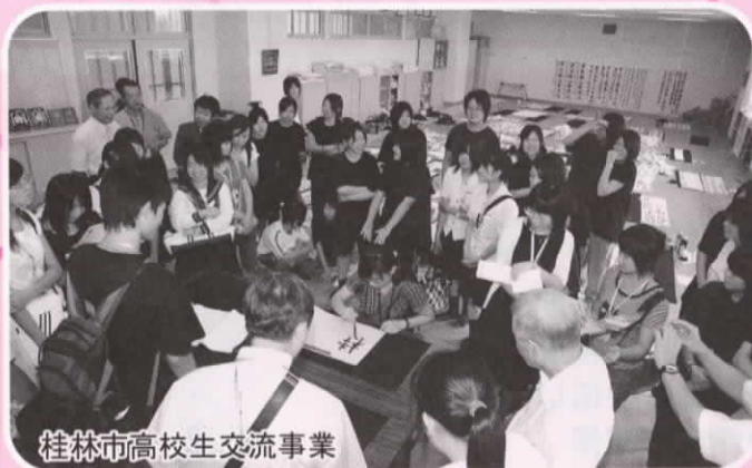
桂林市高校生交流事業