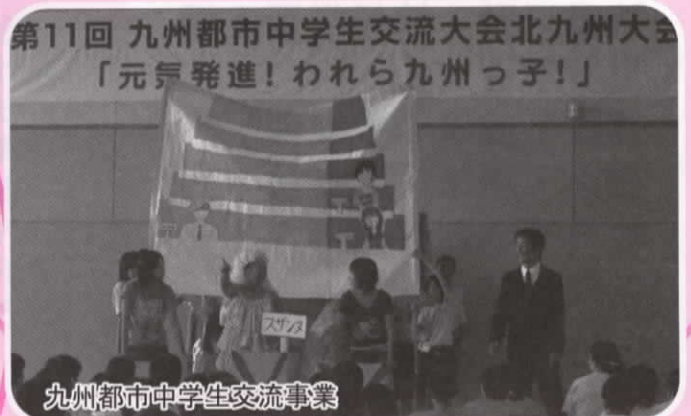
九州都市中学生交流事業

熊本市教育委員会では、 広い視野を持つ人材を育成するために、 友好姉妹都市や九州各都市との 青少年交流活動を実施しています。