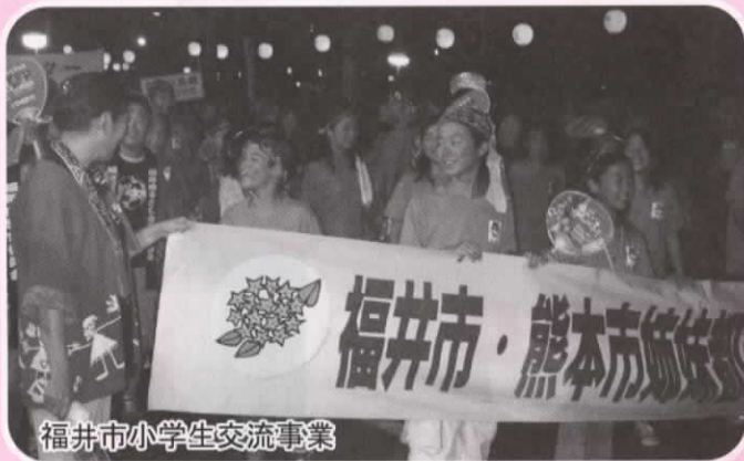
福井市小学生交流事業

(受入) 平成20年8月7日～8月10日 (派遣) 平成21年1月9日～1月12日