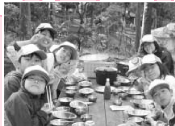
笑顔いっぱいの子どもたち

【詳しいお問合せ先(ご利用にあたっては事前のお申込みが必要です。)】 熊本市教育委員会生涯学習課 TEL096-328-2736 FAX096-359-5833 ※熊本市ホームページ内に「熊本市立あそ教育キャンプ場ホームページ」を開設しています。