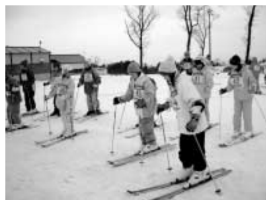
福井でのスキー体験風景

1月5日から8日まで、姉妹都市福井市へ小学6年生、25名の交流訪問団を派遣し、ホームステイやスキー体験などの交流活動を行いました。昨年夏には、福井市の小学生が来熊し、その後電話やメールで交流を深めてきました。