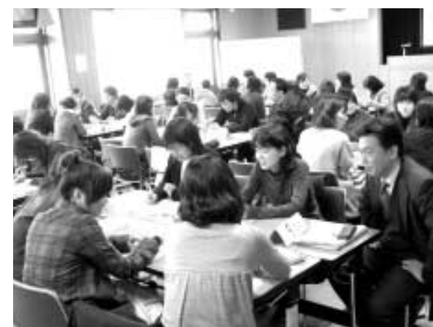
ユア・フレンドの研修会

閉じこもり状態だったけど、学校でユアフレンドに会うことを目的に登校するようになりました。