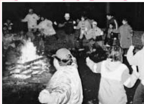
キャンプファイアーは楽しいな

格安にご利用になれます! 利用料……………無料 まき代……………25円 シーツ代……………140円 合計 165円 (1泊2日・ひとり当たり)