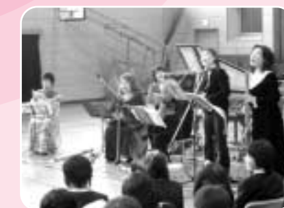
グループでのみなさんをお招きして鑑賞と踊り体験の授業(奥古閑小学校)