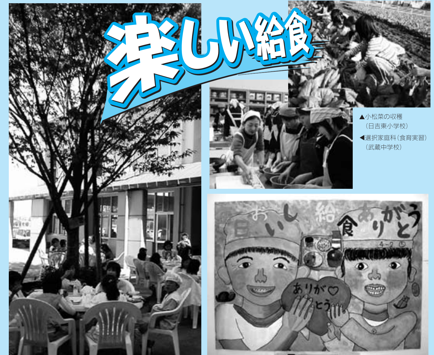
木陰の給食(桜木東小学校)