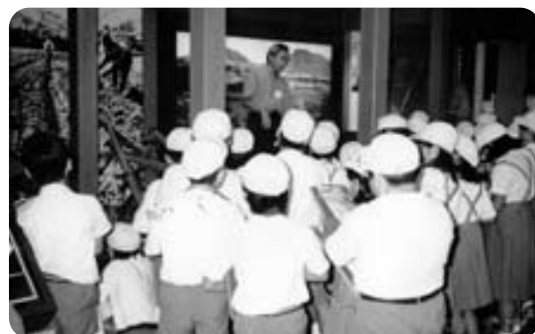
熊本博物館での説明