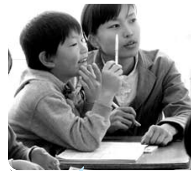
3年生の算数の時間（東町小） 子どもたちと同じ目線で語りかけ

派遣先 幼稚園1園、小学校10校、中学校12校、高等学校1校 研修生 熊本大学教育学部4年生及び大学院生 25名