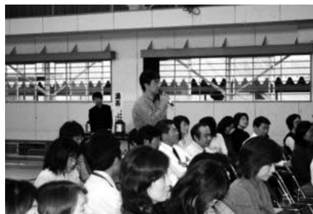
会場のおとなの人からの意見