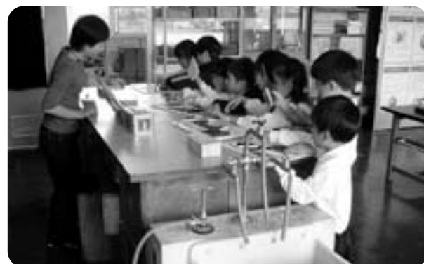
移動博物館での説明

学級活動時の案内もできますので、ご来館の際はご依頼ください。なお、団体観覧は、事前手続きをお願いします。