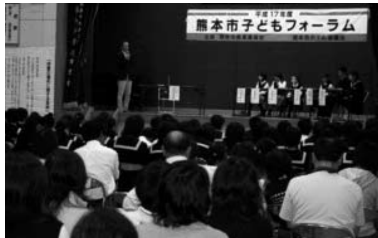
西山中学校区の様子

平成17年度は、錦ヶ丘、西山、東野、桜山の4中学校区で開催しました。それぞれの取り組みについて紹介します。