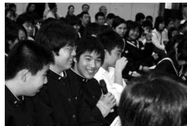
会場の子供たちからの意見