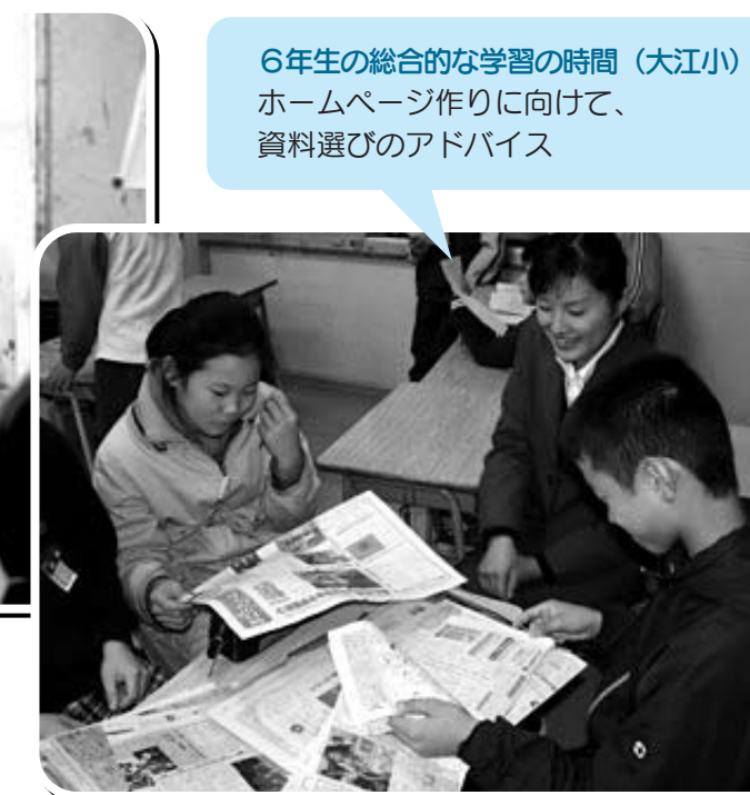
6年生の総合的な学習の時間（大江小） ホームページ作りに向けて、 資料選びのアドバイス