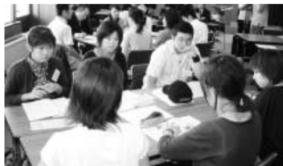
ユア・フレンドの研修会

学校へ通いたくても通えない不登校の子どもたちの心の居場所づくりを目指し、熊本大学教育学部の学生を家庭や学校に派遣し、相談相手になってもらっています。これまでの活動を通して、人間関係やコミュニケーションに悩む児童生徒に「笑顔が見られるようになった」「家庭外で活動ができた」「授業を受けることができた」等の変化が見られています。